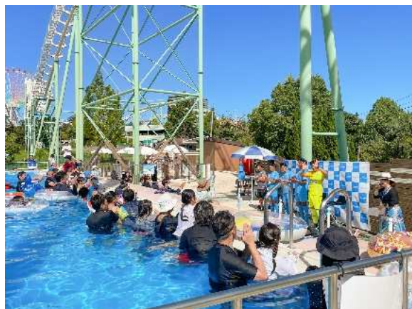
お客さまはプールの中からトークショーを観覧。