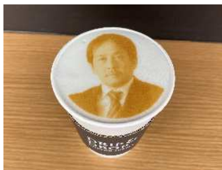
二川監督の顔写真がプリントされたラテ