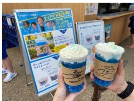
完売したティアモブルーソーダ

園内の「ドリップ&ドロップ コーヒーサプライ」と「ディッピングドッツ・アイスクリーム」にてコラボドリンクを販売しました。チームカラーのティアモブルーをイメージしたドリンク「ティアモブルーソーダ」は、選手のサイン入りスリーブ付きで予定数が売り切れる人気ぶりでした。二川監督の顔写真がプリントされたラテアートは、そのリアルさに思わず驚きの声を上げるお客さまもいらっしゃいました。